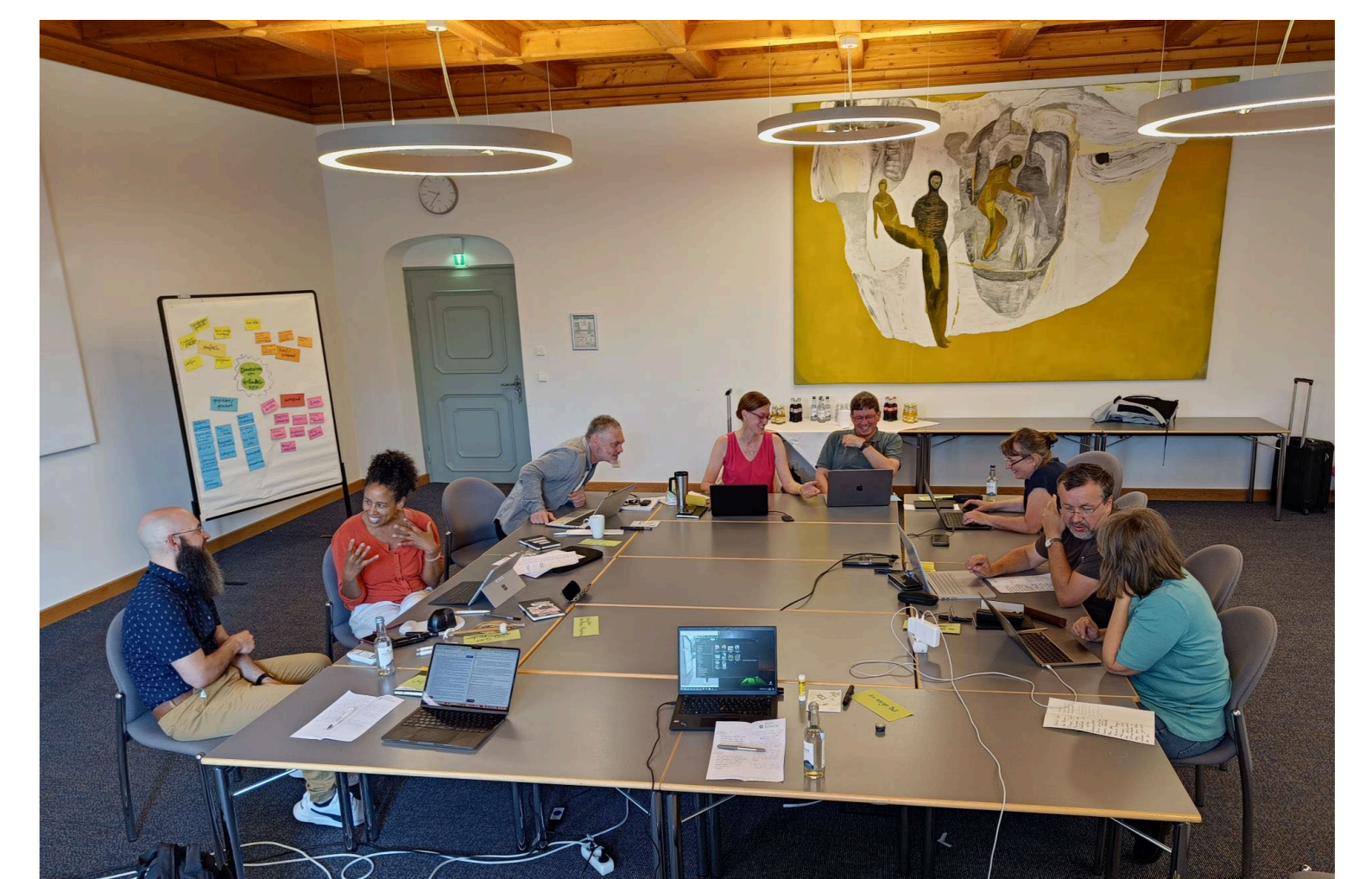
Impression aus einem Writing Retreat

Werfen Sie einen Blick auf die Projektseite!