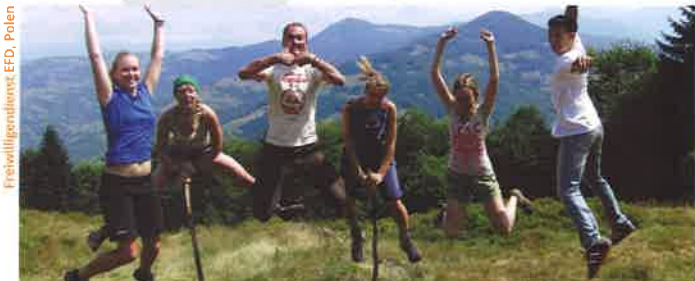
Freiwilligendienst EFD, Polen