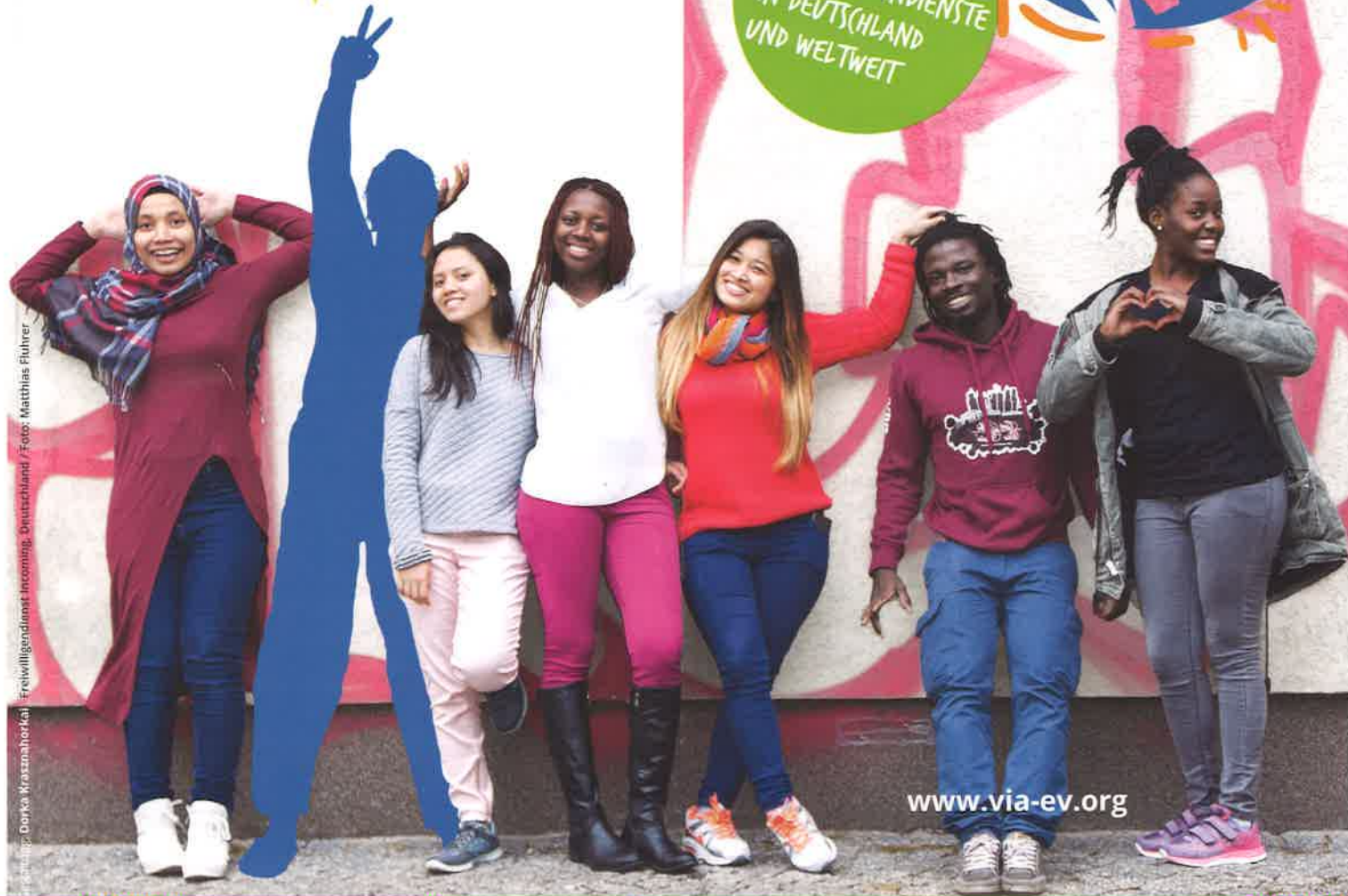
Foto: Dora Kraszmalhorkai | Freiwilligendienst Incoming, Deutschland / Foto: Matthias Flührer