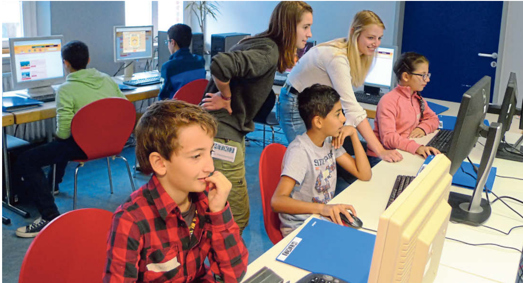
Beliebt: Etwa 15 Kinder nehmen dieses Mal am Seminar teil.

Das Vorhaben richtet sich an Kinder zwischen 8 und 15 Jahren. „Es ist in der heutigen Zeit sehr wichtig, dass Kinder Medienkompetenzen vermittelt bekommen und lernen, mit Technik umzugehen“, sagte