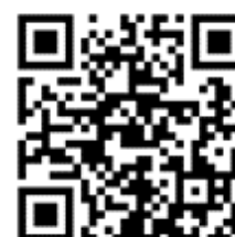
Webseite des GKW

Senden Sie Ihre Anmeldung und/oder Fragen zu den Veranstaltungen gerne an gradz@kw.uni-paderborn.de . Weitere Informationen rund um wissenschaftliche Qualifikationsphasen finden Sie auf den Webseiten des Graduierenzentrums KW.