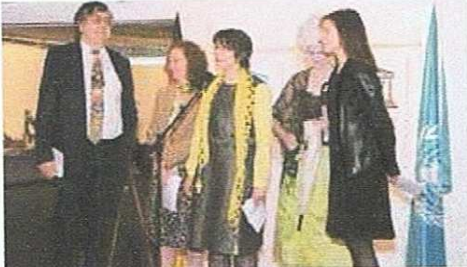
Bild vergrößern Eröffnungsrede der deutschen Botschafterin Martina Nibbeling-Wrießnig