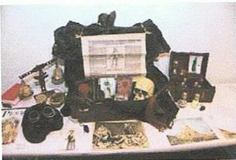
Bild vergrößern Koffer: Die Pest in Venedig und seine Lagunen