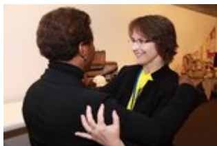
Übergabe Welterbekoffer Tai-Nationalpark