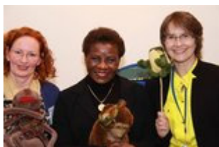
Übergabe Welterbekoffer Tai-Nationalpark