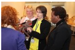
Übergabe Welterbekoffer Tai-Nationalpark