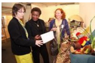
Übergabe Welterbekoffer Tai-Nationalpark