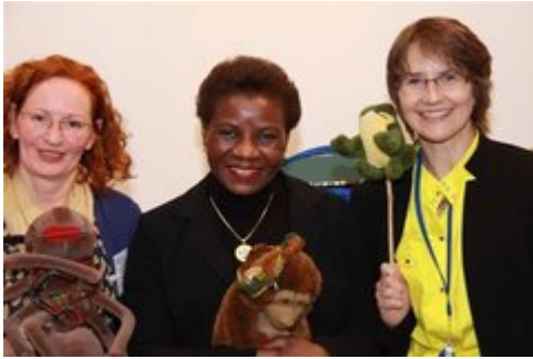
Übergabe Welterbekoffer Tai-Nationalpark