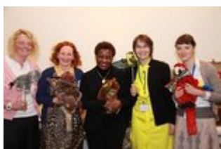
Übergabe Welterbekoffer Tai-Nationalpark